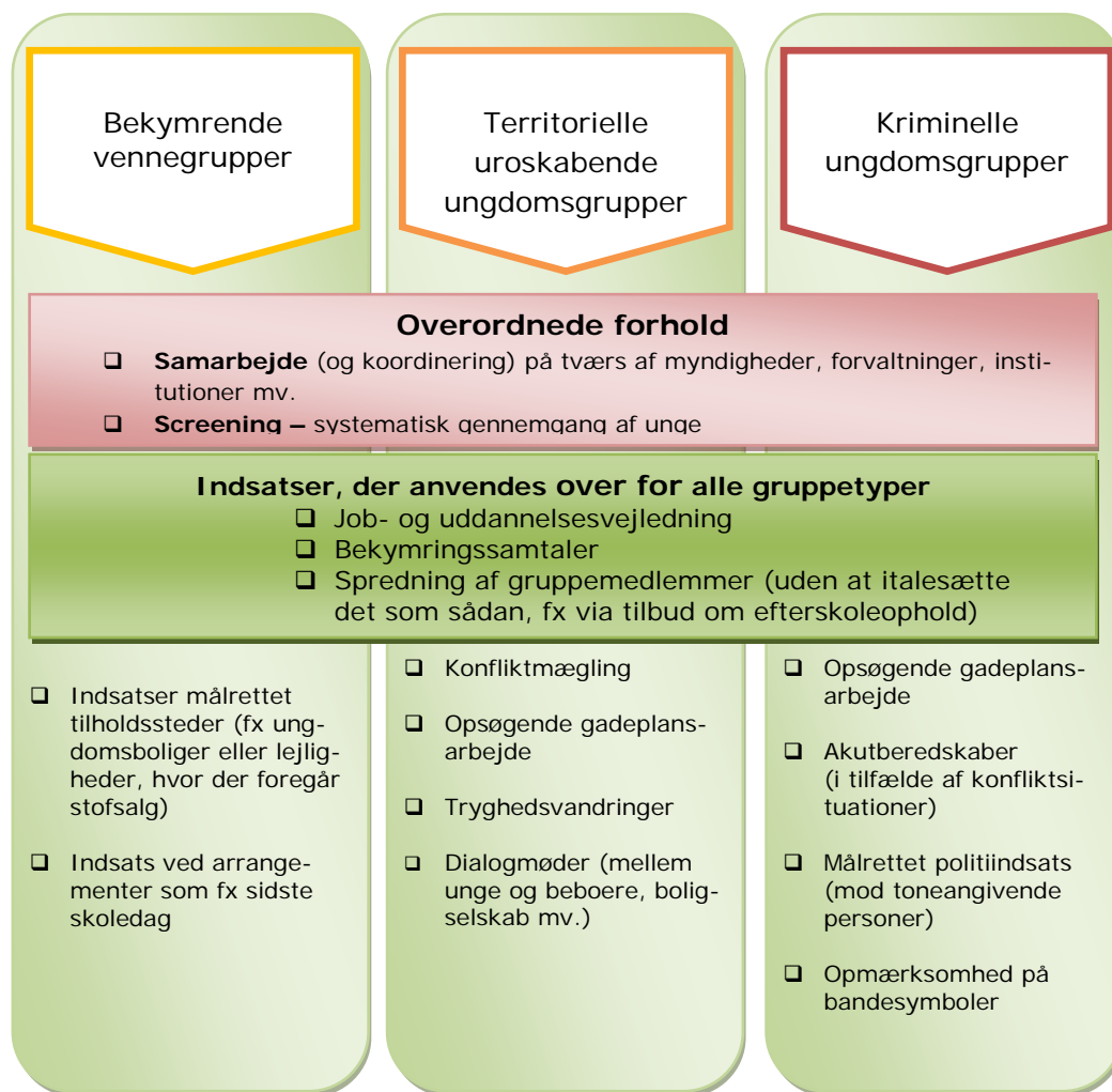
Figur 6: Overblik over forebyggende initiativer

Helt overordnet flød alle vores interviewpersoner over med engagement og lyst til feltet, og de havde et væld af beretninger om, hvad de gjorde i det forebyggende arbejde. Udover engagementet og begejstringen bed vi også mærke i professionalismen og refleksionen, der mødte os. Det er ikke det samme som, at der blev argumenteret for den samme faglige tilgang alle steder. I et felt med så stor metodefrihed, er det nok også naturligt, at der vil opstå lejre eller dilemmaer. Vi sætter nogle af disse dilemmaer op til slut i afsnittet og diskuterer, hvordan de kan bruges i det forebyggende arbejde.