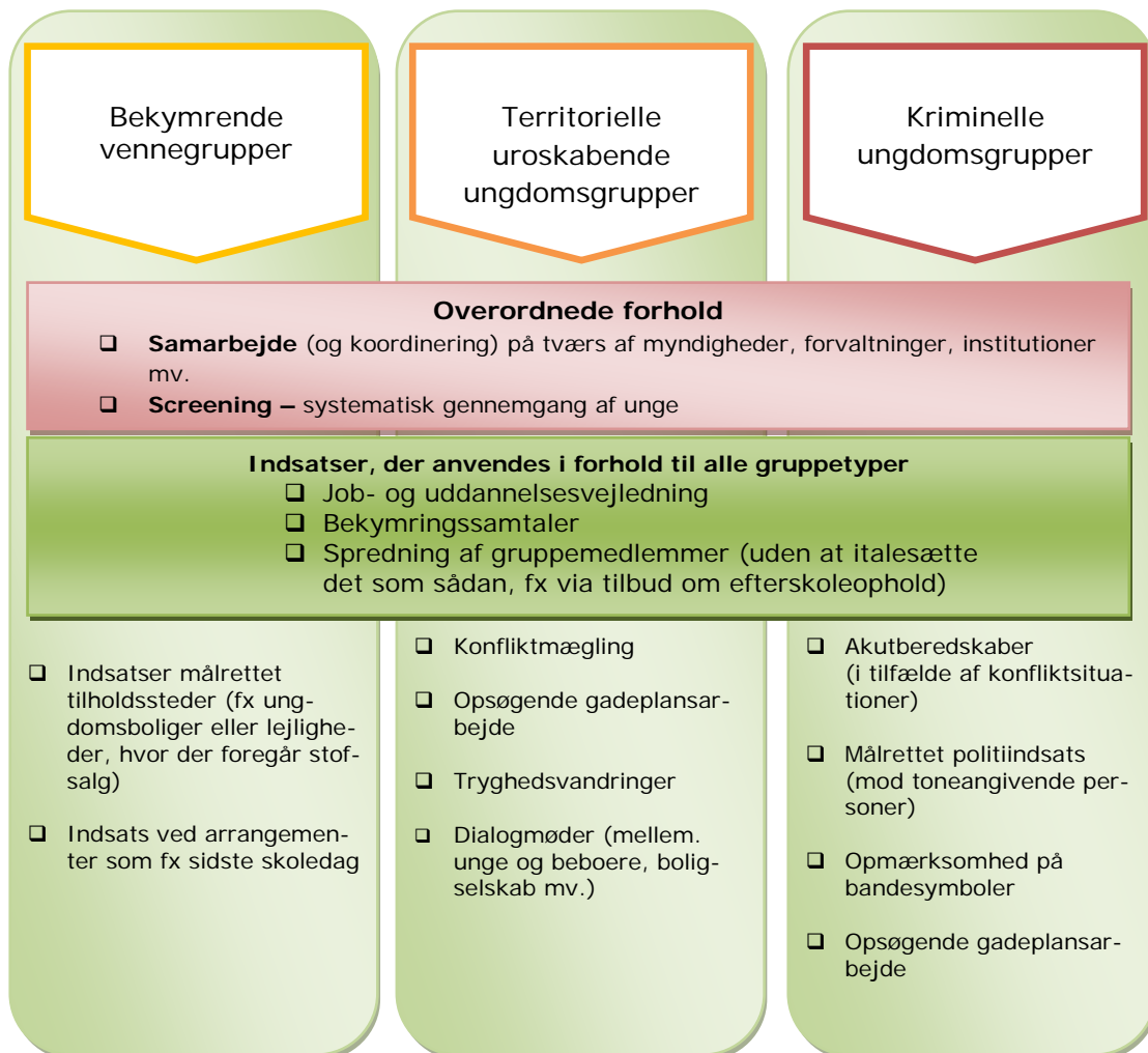
Figur 1. Overblik over forebyggende initiativer