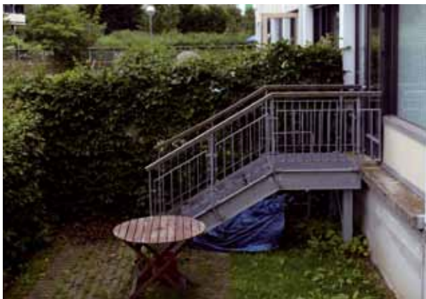
Rod og uorden giver utryghed.

Se hvordan I organiserer en tryghedsvandring på dkr.dk