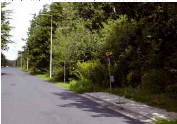
Grønt kan være godt - men det skal holdes ved lige, og der skal være afstand til opholds- og færdselsområder. Hvem har lyst til at vente på bussen ved dette stoppested en mørk aften? Og hvem har lyst til at bruge "friarealet" herunder?