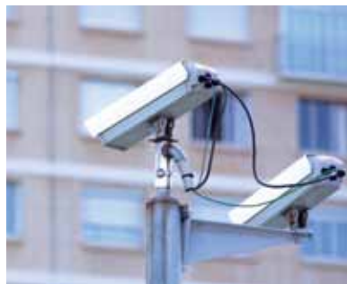
Optagelserne skal slettes efter 30 dage.

Læs mere om kravene til opbevaring, sletning, videregivelse og sikkerhed på datatilsynet.dk .