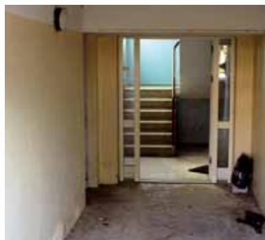
Mange steder har man opsat kameraer i kældre for at undgå påsatte brande.