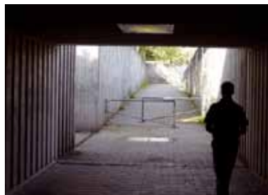
Tv-overvågning egner sig ikke til at forebygge personfarlig kriminalitet som vold og voldtægt.

Kameraerne er sjældent bemandede, og derfor kommer der ikke hjælp fra en vagtcentral, hvis der sker noget. Optagelserne bruges normalt kun i forbindelse med efterforskning af forbrydelser.