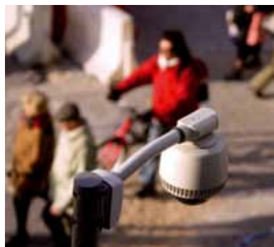
Kameraerne skal være så effektive, at man kan se, hvad der sker og hvem der er på billederne.