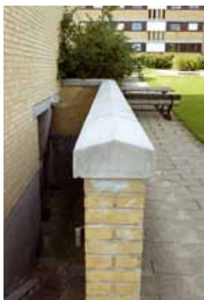
En mørk kældertrappe er ikke behagelig.

En nedslidt og kedelig legeplads indbyder ikke til leg.