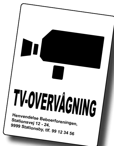
Skriv kontaktoplysninger på overvågningsskiltene.

Det europæiske bynetværk, "Forum for Urban Security" (EFUS) har opstillet flere gode principper for tv-overvågning. Læs mere om principperne på dkr.dk .