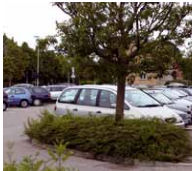
Parkeringspladser er et af de steder, hvor tv-overvågning ser ud til at have en positiv effekt.

Tv-overvågning kan altså virke præventivt nogle steder og over for nogle kriminelle og nogle typer kriminelle handlinger.