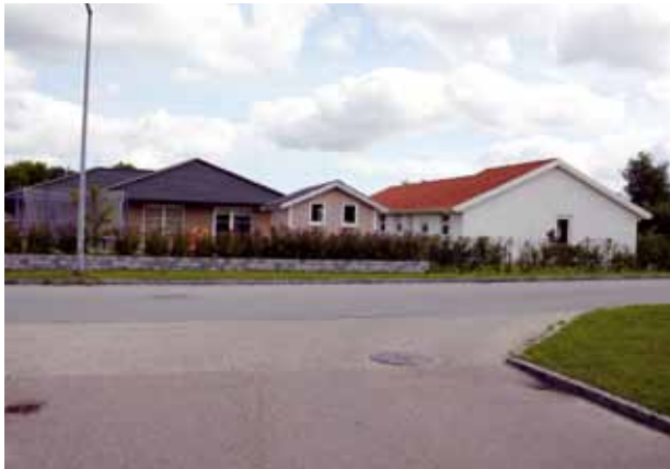
Hvor er der rarest at færdes for beboerne - og indbrudstyven? Her?