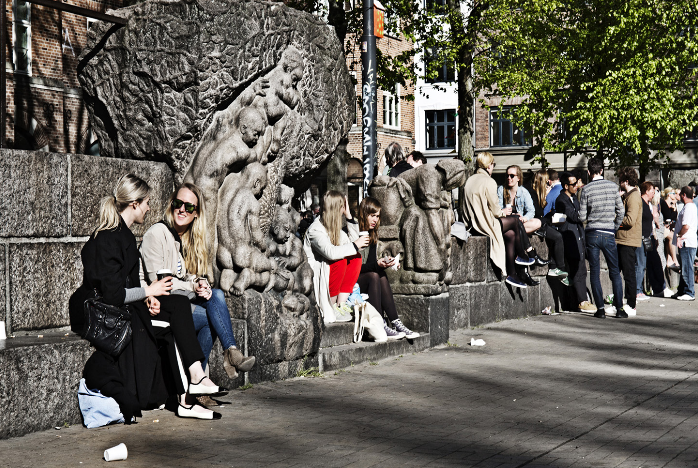
Naturlig overvågning, hvor der er folk i byrummet mange af døgnetimer, er den mest kriminalpræventive og tryghedsskabende faktor.

socialt liv positivt og så et kriminalpræventivt potentiale i fremmede og gæster, som overvågere i bolig- og byområder, mente Newman