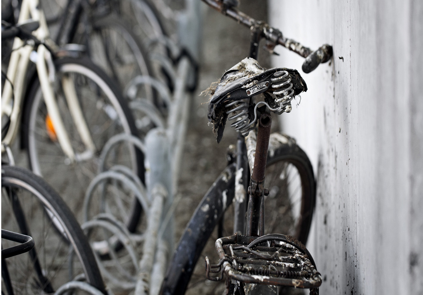
Uorden og graffiti kan skabe utryghed.