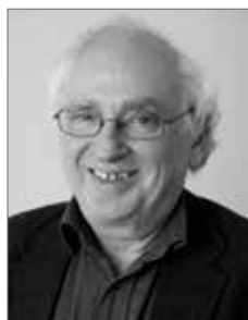
Ole Pass Socialchefforeningen i Danmark