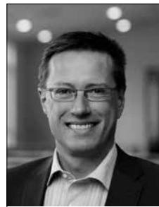
Thorkild Fogde Politidirektør Politiet