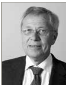
Poul B. Løhde Politidirektør Politiet